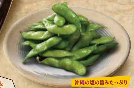
沖縄の塩の旨みたっぷり 枝豆 490