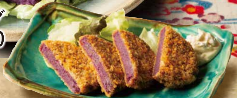
紅イモのポテトコロッケ 690