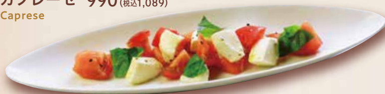
カプレーゼ 990 (税込1,089) Caprese