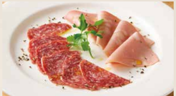
ミラノサラミ&イタリアモルタデッラハム Milano Salami & Italian Mortadella 1,040 (税込1,144)