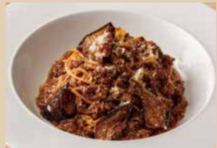
たっぷり牛肉と茄子のボロネーゼ Bolognese Meat Sauce Spaghetti with Eggplant 1,890 (税込2,079)