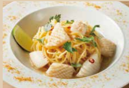
イカとからすみのペペロンチーノ Peperoncino Spaghetti with Squid & Bottarga 1,690 (税込1,859)