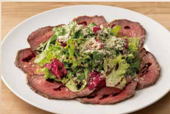
牛もも肉のカルパッチョ風サラダ Beef Round Carpaccio with Salad 1,440 (税込1,584)