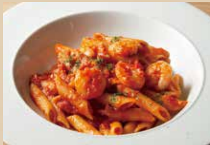
ペンネアラビアータ Penne Arrabbiata 1,490 (税込1,639)