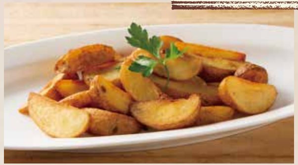
アンチョビガーリックフライドポテト French Fries with Anchovy Garlic Flavor 790 (税込869)