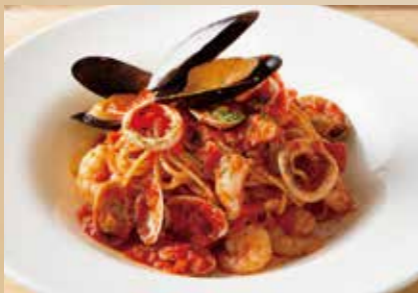
魚介のペスカトーレ Pescatore Spaghetti 1,790 (税込1,969)