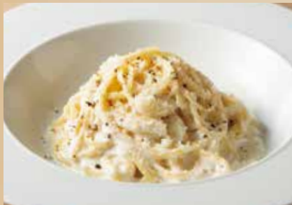
ゴルゴンゾーラチーズクリーム Cream Sauce Spaghetti with Gorgonzola Cheese 1,590 (税込1,749)