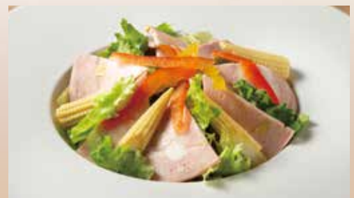
イタリアモルタデッラハムのサラダ Italian Mortadella Salad 1,290 (税込1,419)