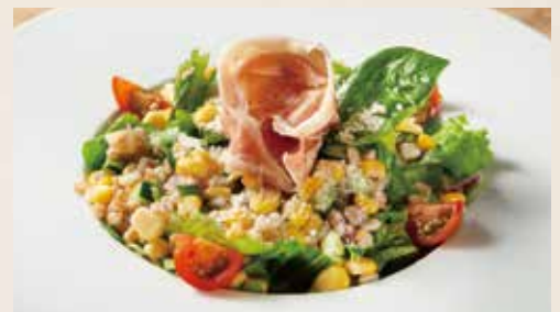
生ハムとペコリーノチーズ、ファッコの イタリアンサラダ Chopped Salad (Italian Dry Cured Ham, Pecorino Cheese, Farro, etc) 1,340 (税込1,474)