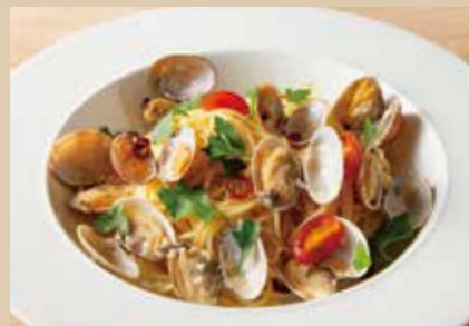
ボンゴレビアンコ Vongole Bianco Spaghetti 1,690 (税込1,859)