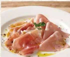
生ハム&イタリアモルタデッラハム