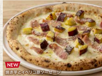
NEW 焼き芋とイベリコ豚ソーセージ