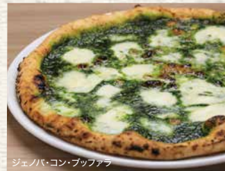
ジェノバ・コン・ブッフアラ