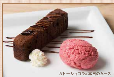
ガトーショコラ&本日のムース