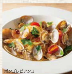
ボンゴレビアンコ