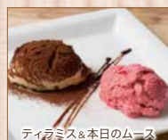
ティラミス&本日のムース