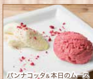
パナコッタ&本日のムース