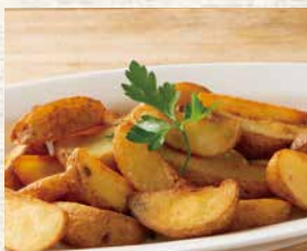
アンチョビガーリックフライドポテト

生ハム&イタリアモルタデッラハム ..... 1,140 (税込1,254) Dry Cured Ham & Italian Mortadella