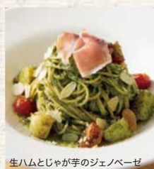
生ハムとじゃが芋のジェノベーゼ

渡り蟹のトマトクリーム Tomato Cream Sauce Spaghetti with Blue Crab 1,690 (税込1,859)