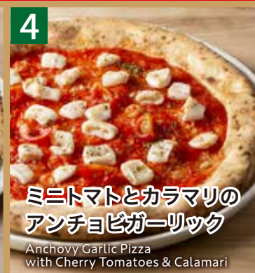
4 ミニトマトとカラマリの アンチョビガーリック

Anchovy Garlic Pizza with Cherry Tomatoes & Calamari