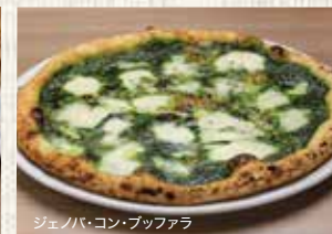
ジェノバ・コン・ブッフアラ