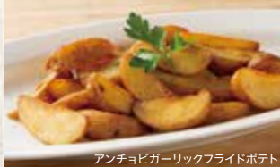
アンチョビガーリックフライドポテト

アンチョビガーリックフライドポテト ..... 790 (税込869) French Fries with Anchovy Garlic Flavor