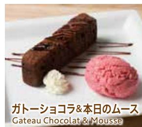
ガトーショコラ&本日のムース Gateau Chocolat & Mousse

For an extra 350 (incl. tax 385), you can add a dessert to your order