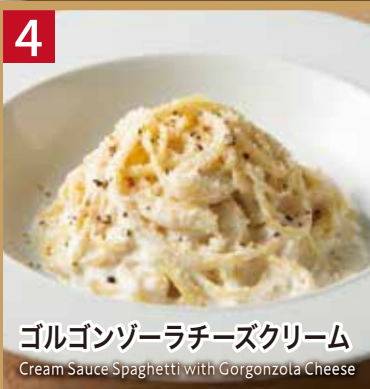
4 ゴルゴンゾーラチーズクリーム

Cream Sauce Spaghetti with Gorgonzola Cheese