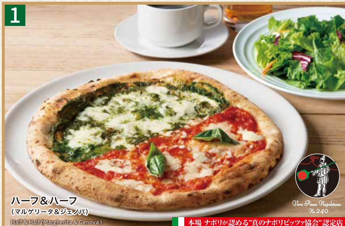
1 ハーフ&ハーフ (マルゲリータ&ジェノバ)