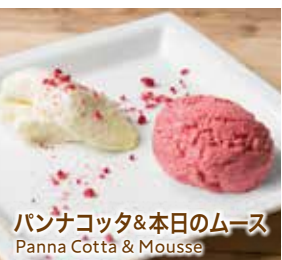
パナコッタ&本日のムース Panna Cotta & Mousse

▶ セットドリンクはこちらよりお選びください Choose your drink from below.