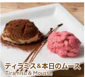
ティラミス&本日のムース Tiramisu & Mousse