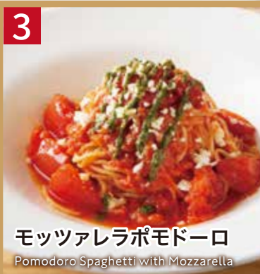
3 モッツアレラポモドーロ

Cream Sauce Spaghetti with Spicy Cod Roe