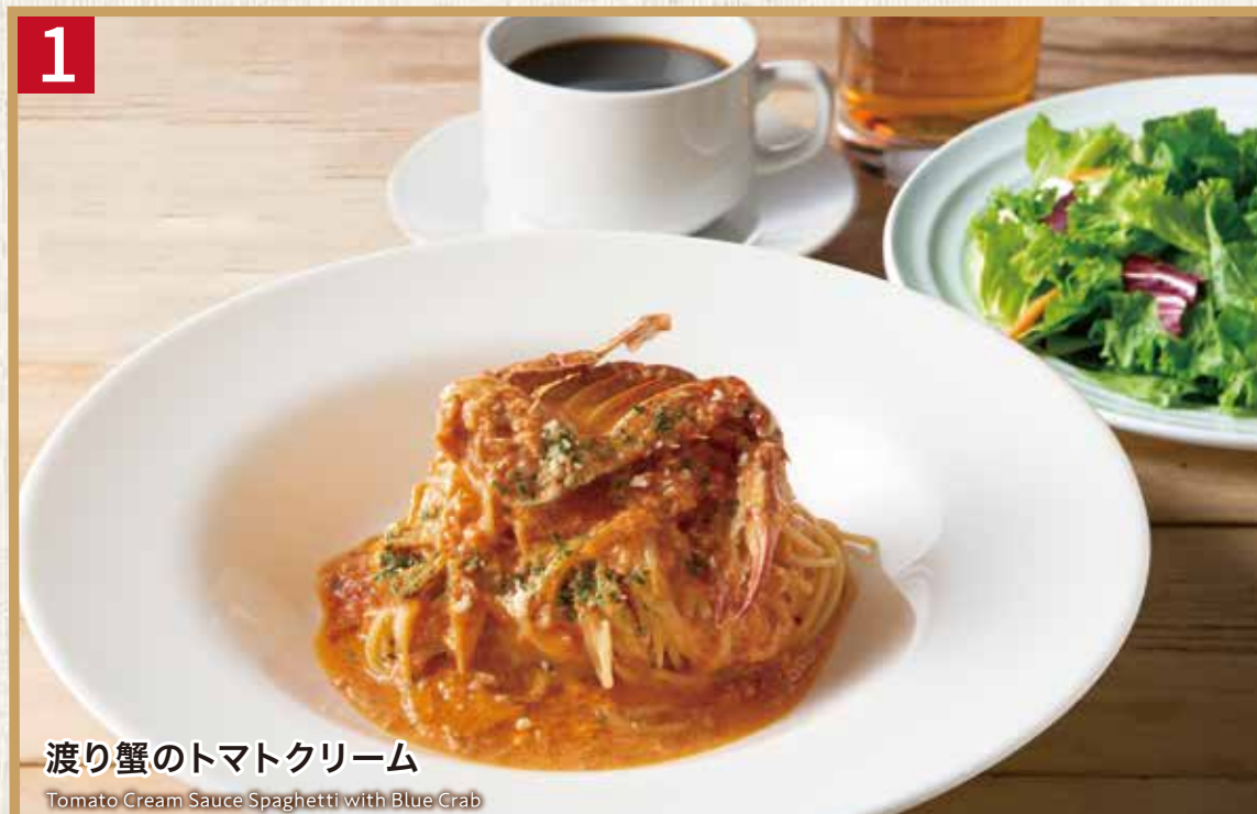
1 渡り蟹のトマトクリーム

パスタ大盛り +400 (税込440) Plus 400 (税込440) for Large size