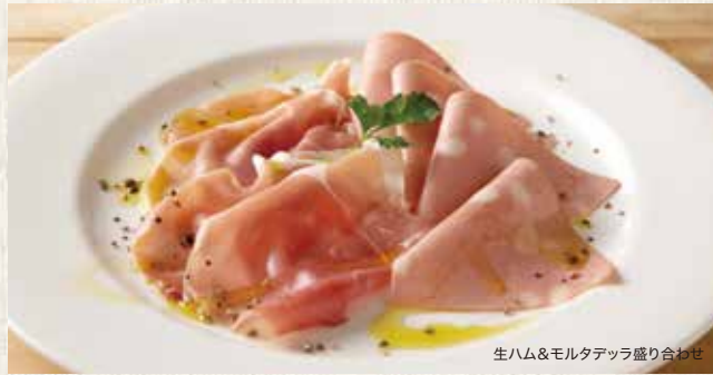
生ハム&モルタデッラ盛り合わせ