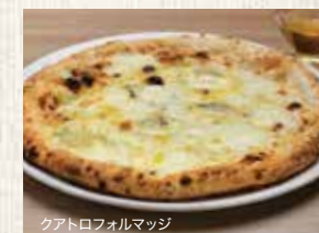
クアトロフォルマッジ

マルゲリータ・エクストラ Margherita Extra (PIZZA D.O.C) トマトソース・水牛のモzzarella・チェリートマト・バジリコ 2,390 (税込2,629)