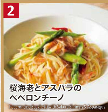
2 桜海老とアスパラの ペペロンチーノ

Tomato Cream Sauce Spaghetti with Blue Crab