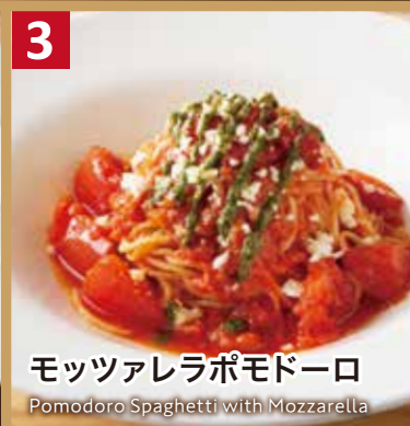
3 モッツアレラポモドーロ

Peperoncino Spaghetti with Sakura Shrimps & Asparagus