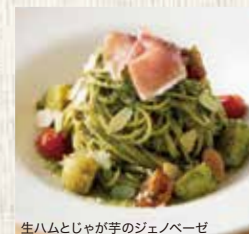
生ハムとじゃが芋のジェノベーゼ

渡り蟹のトマトクリーム Tomato Cream Sauce Spaghetti with Blue Crab 1,690 (税込1,859)