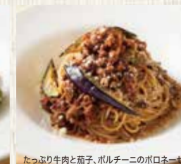
たっぷり牛肉と茄子、ポルチーニのボロネーゼ