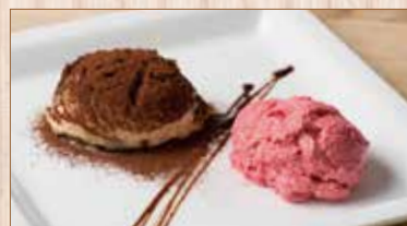
ティラミス&本日のムース Tiramisu & Mousse

▶ドルチェはこちらよりお選びください Choose your dolce from below.