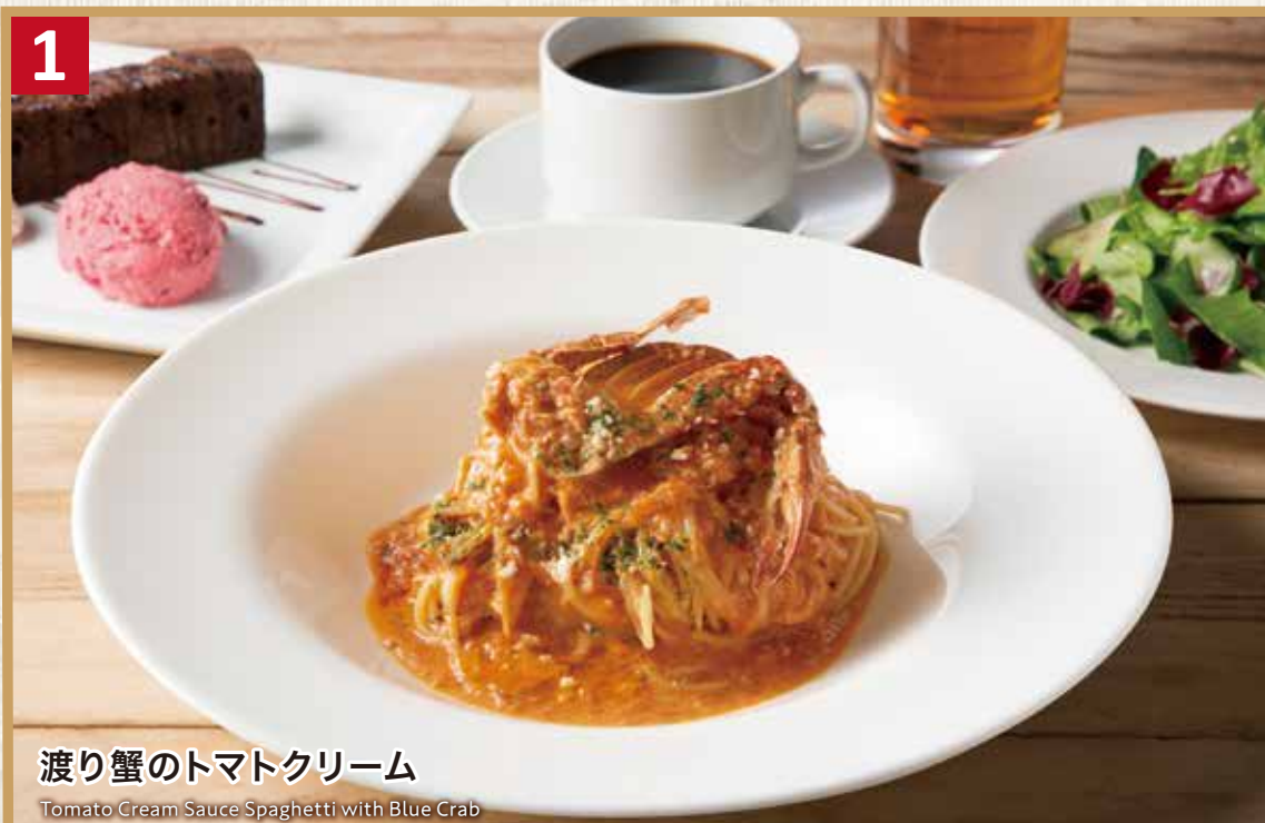
1 渡り蟹のトマトクリーム

パスタ大盛り +400 (税込440) Plus 400 (税込440) for Large size