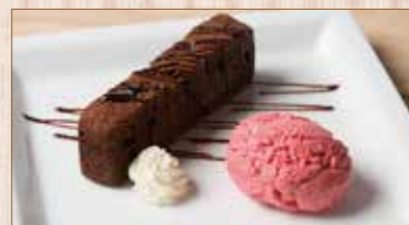
ガトーショコラ&本日のムース Gateau Chocolat & Mousse

▶セットドリンクはこちらよりお選びください Choose your drink from below.