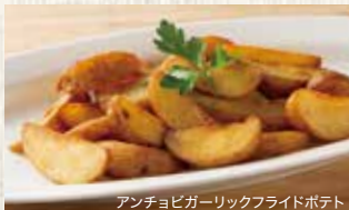
アンチョビガーリックフライドポテト

アンチョビガーリックフライドポテト ..... 790 (税込869) French Fries with Anchovy Garlic Flavor