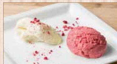
パンナコッタ&本日のムース Panna Cotta & Mousse