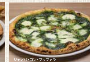
ジェノバ・コン・ブッフアラ