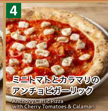
4 ミニトマトとカラマリの アンチョビガーリック

Anchovy Garlic Pizza with Cherry Tomatoes & Calamari