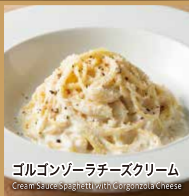
ゴルゴンゾーラチーズクリーム

Cream Sauce Spaghetti with Gorgonzola Cheese