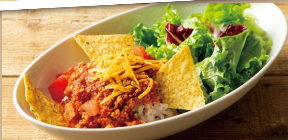
タコライスボウル