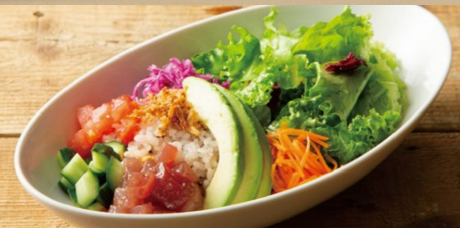
マグロとアボカドのポキボウル