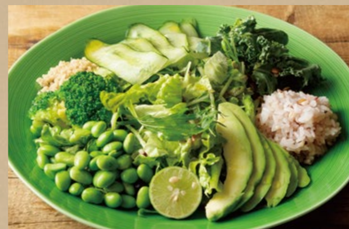
ヴィーガングリーンサラダ