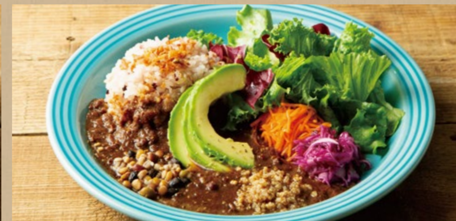
アボカドと雑穀のソイミートカレー