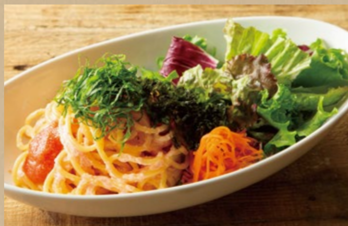
明太子クリームパスタ