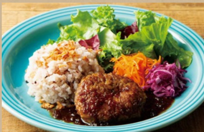
オニオンソースのハンバーグ