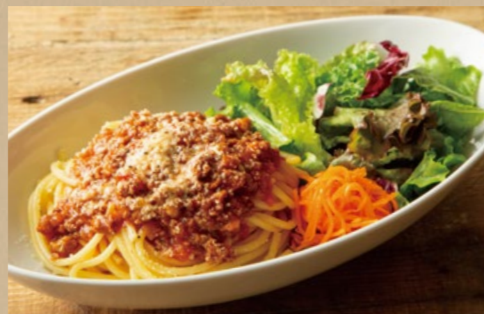
ミートソースパスタ