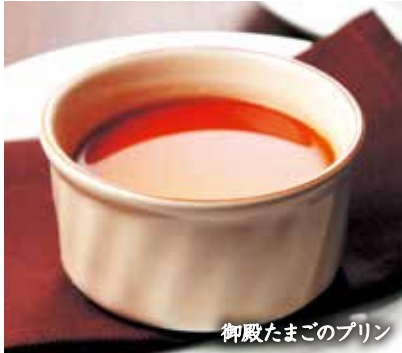
御殿たまごのプリン