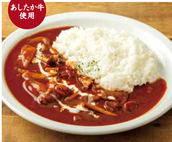
クラシックハヤシライス