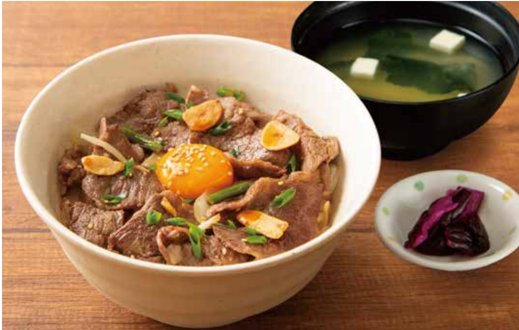
あしたか牛のスタミナ丼定食 ¥1,890 〈味噌汁・お新香付き〉