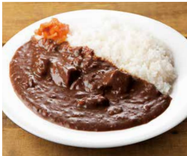
スパイシービーフカレー