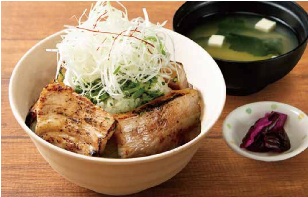
静岡県産もち豚の伊豆味噌焼き丼定食 ¥1,890 〈味噌汁・お新香付き〉