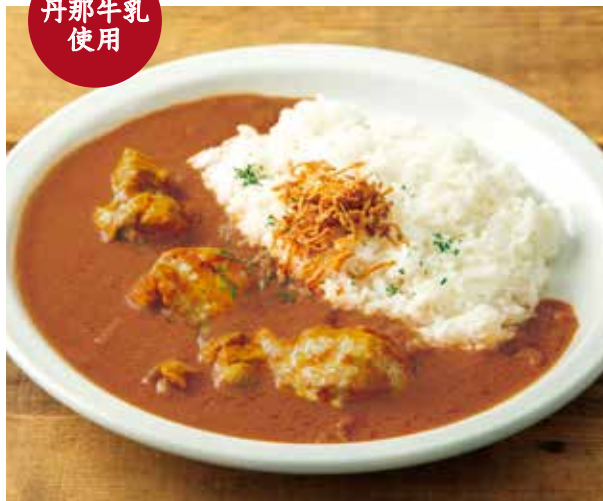
バターチキンカレー