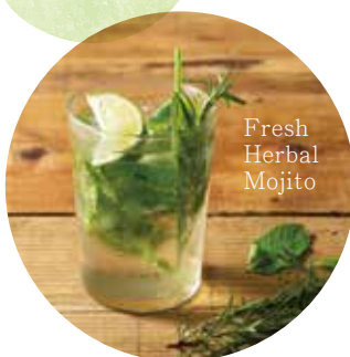
Fresh Herbal Mojito