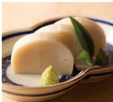
小田原鈴廣 板わさ 840