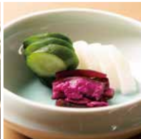
お新香盛り合わせ 540