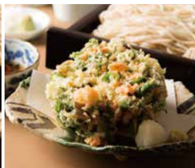
桜海老と小柱のかき揚げせいろ 1,990