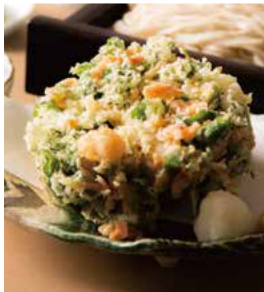
桜海老と小柱のかき揚げ 1,140