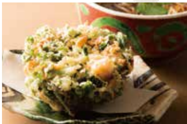
桜海老と小柱のかき揚げそば 1,990