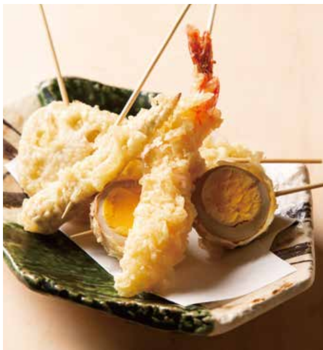
串天ぷら盛り合わせ 590