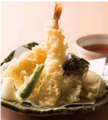
天ぷら盛り合わせ 890