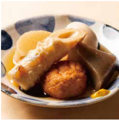
おでん盛り合わせ 790