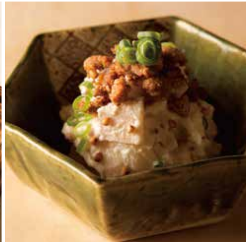
そば屋のポテトサラダ 590