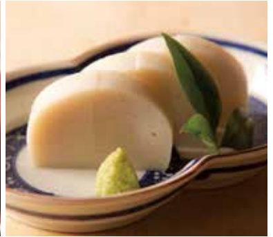
小田原鈴廣 板わさ 790