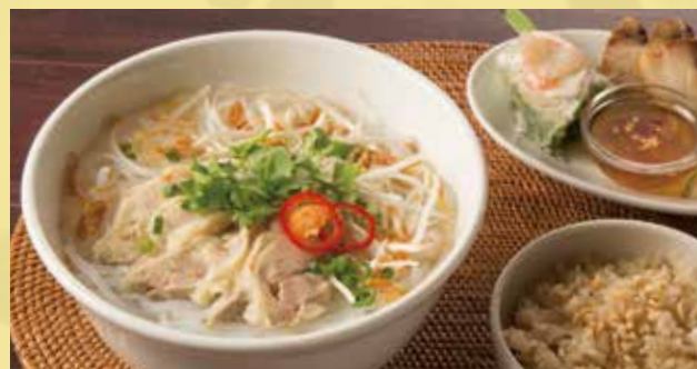
Cellophane Noodles Soup with Chicken Set 1,400 鶏肉のフォー定食 さっぱりとしたシンプルな味わい