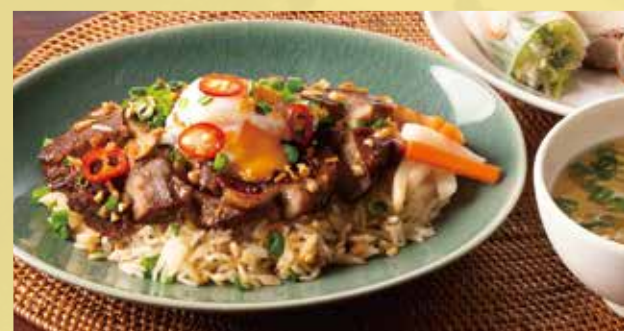
Vietnamese Stewed Pork with Egg on Rice Set 1,650 豚煮飯定食 柔らかく煮込んでからカリッと揚げた豚肉ののっけ飯