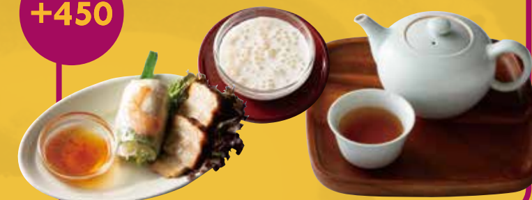
Value! お得! Tapioca Coconut milk + Vietnamese Deli + Vietnamese Lotus Tea タピオカココナッツミルク + ベトナム惣菜 + ロータス茶