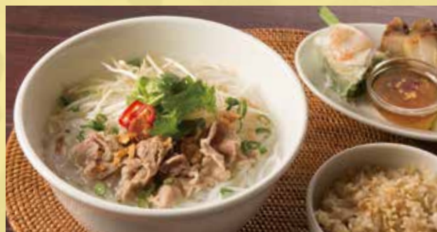
Cellophane Noodles Soup with Thin Sliced Beef Set 1,500 牛肉のフォー定食 あっさりスープに牛の旨みがGood!