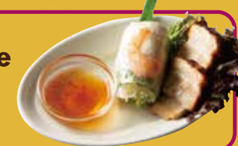
Vietnamese Deli ベトナム惣菜