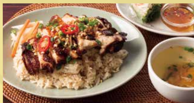
Vietnamese Chicken Rice Set 1,500 鶏飯“コムガー”定食 シクロのロングセラー。ジューシーでやわらか