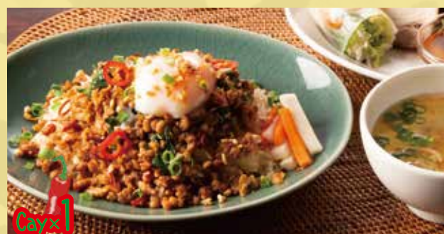
Stir-fried Minced Pork & Basil with Egg on Rice Set 1,450 豚そぼろのバジル炒め飯定食 スパイシーな豚そぼろにとろーり玉子。ご飯にからめてどうぞ!