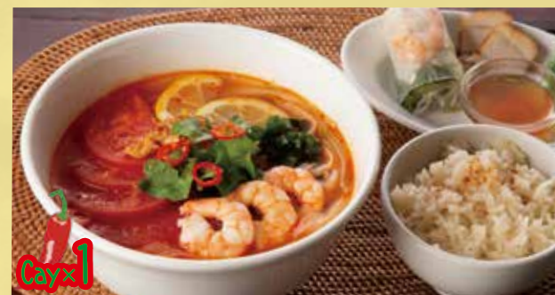
Spicy Cellophane Noodles Soup with Shrimp & Tomato Set 1,600 海老とトマトのスパイシーフォー定食 コクのあるトマトのスープ