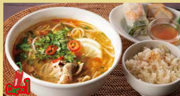
“Hue Style” Spicy Rice Noodles with Thin Sliced Beef Set 1,600 ブンボーフエ定食 牛肉のピリ辛スープの丸麺