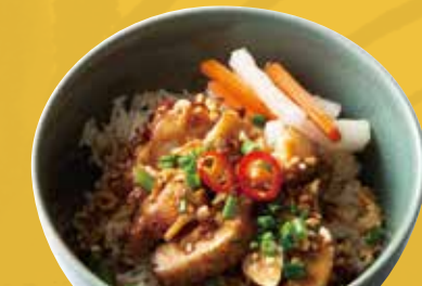
Vietnamese Chicken 鶏飯“コムガー”小丼