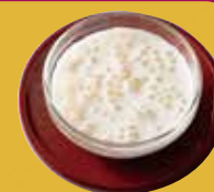
Dessert (Tapioca Coconut Milk) デザート (タピオカココナッツミルク)