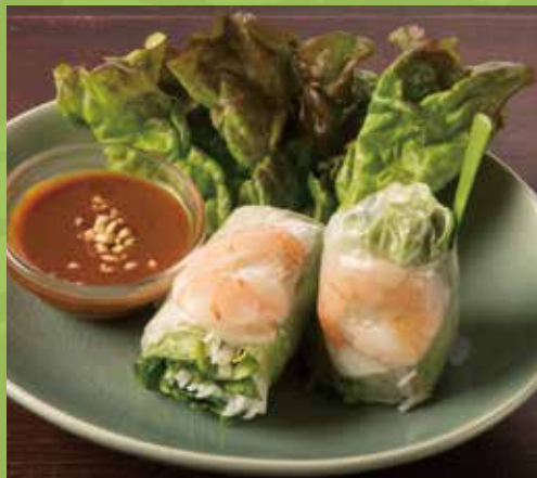
Raw Summer Rolls with Peanut Sauce 600

Shrimp, Pork, Rice Vermicelli, Lettuce & Garlic Chive