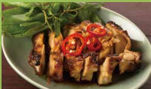
Deep-fried Chicken Marinated with Coconut Water 1,000