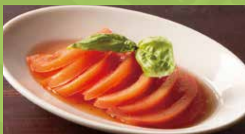
Marinated Tomato 400