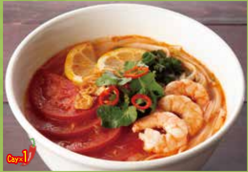
Cellophane Noodles Soup with Shrimp & Tomato 1,100