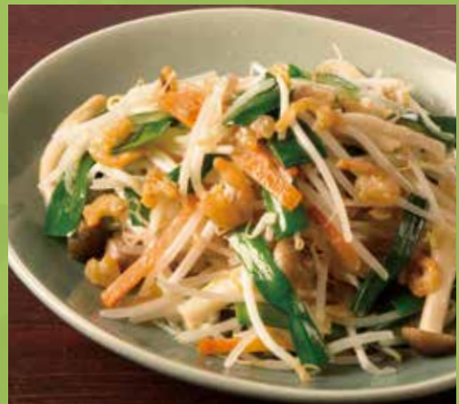
Wok-fried Bean Sprouts & Dried Shrimp with Soy Sauce 850