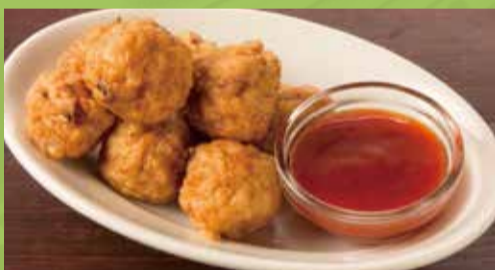
Calamari Cake 500