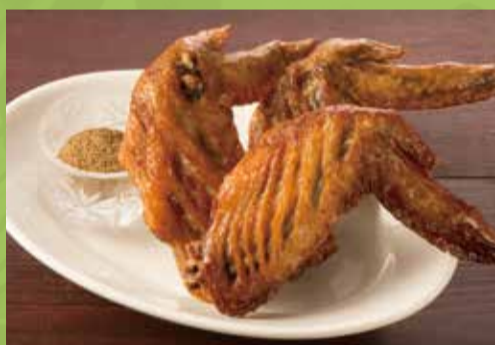
Deep-fried Chicken Wings with Fish Sauce 550