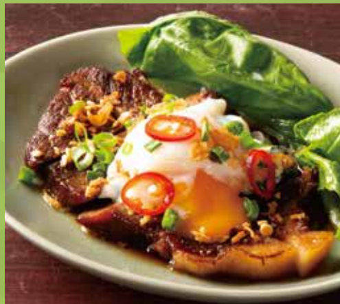
Vietnamese Stewed Pork with Egg 950