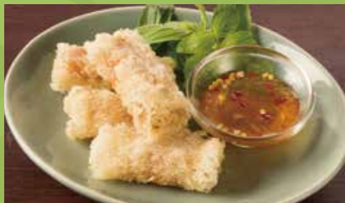
Crispy Spring Rolls with Sweet-sour Sauce 600