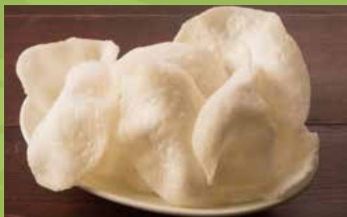
Shrimp Crackers 400