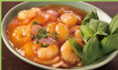
Wok-fried Shrimp & Onion with Tamarind-chili Sauce 1,100