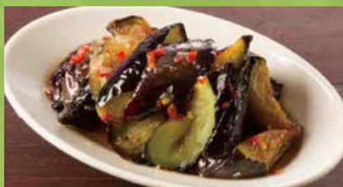
A Little Hot Deep-fried Eggplant