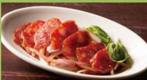
Vietnamese Pork Sausage 500