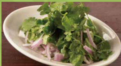
Cilantro & Red Onion 550