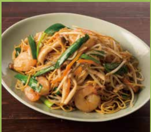
Chow Mein with Shrimp & Vegetables 1,150

ブンボーフェ 【ビリ辛スープの丸麺】ベトナムの都市フエで 親しまれている牛のブンのビリ辛仕立て