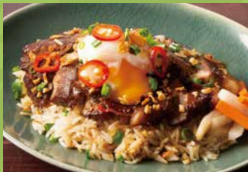
Vietnamese Stewed Pork with Egg on Rice 1,100