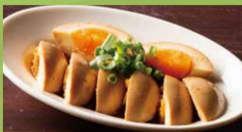
Seasoned Boiled Egg 400