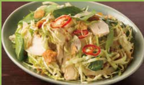
Vietnamese Chicken Salad with Crispy Asian Slaw 850