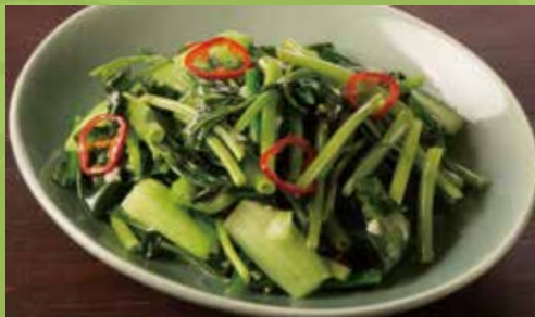
Wok-fried Water Spinach, Bokchoy & Garlic with Fish Sauce 1,000