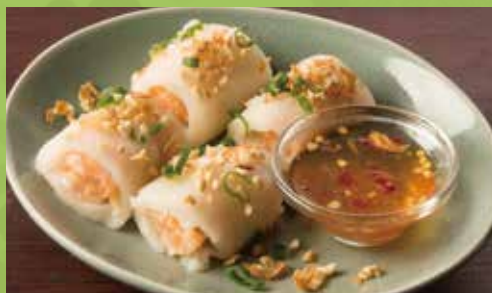
Steamed Spring Rolls with Sweet-sour Sauce 600