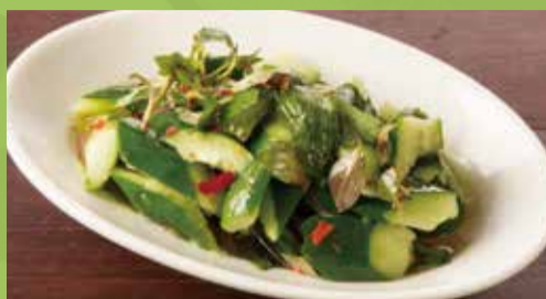
Cucumber with Sweet Chili Sauce 500