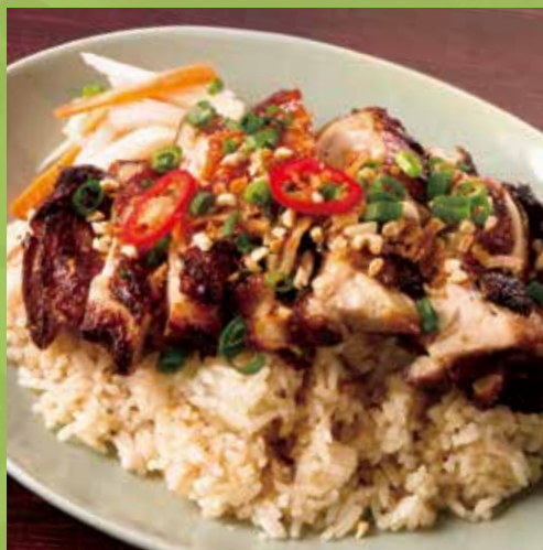
Vietnamese Chicken Rice