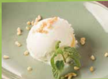
Coconut Ice Cream