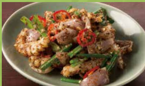
Wok-fried Calamari with Onion, Scallion & Lemongrass 950