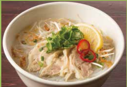
Cellophane Noodles Soup with Chicken 1,050