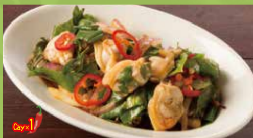
Clam Mixed with Asian Basil & Sweet Chili Sauce 550