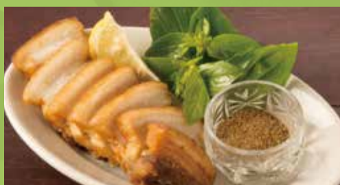
Deep-fried Pork Belly with Japanese Pepper 500