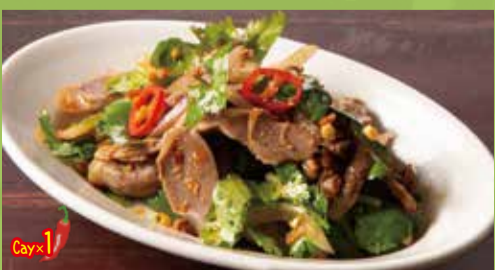
Spicy Cilantro & Jizzard 550