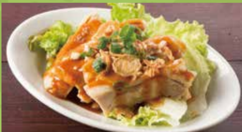
Steamed Chicken Sesame Sauce 500