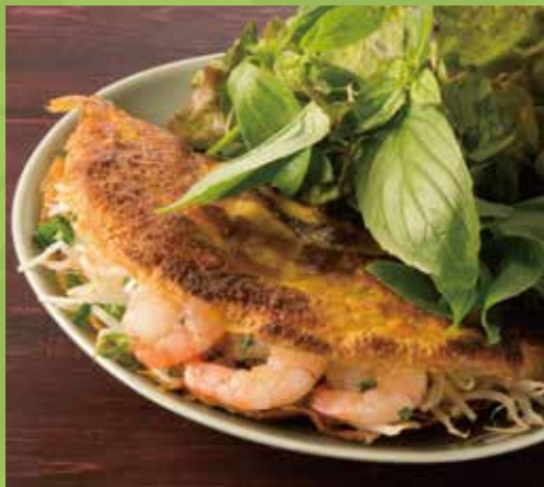
Crispy Pancake with Shrimp, Pork & Asian Herbs 1,200