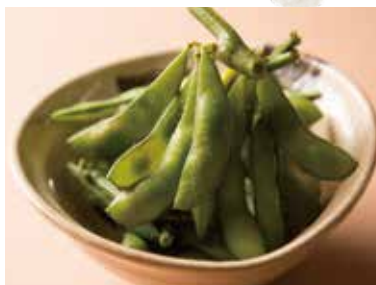
枝豆 Edamame 390