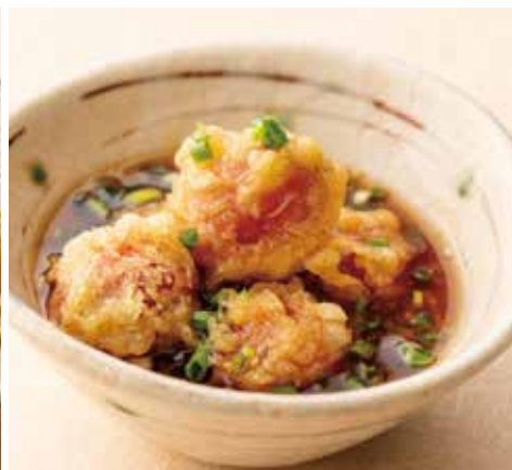
ミニトマトの揚げ浸し