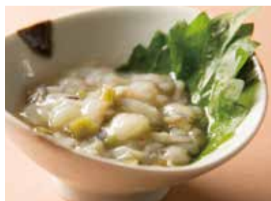
たこわさび Marinated Octopus with Wasabi Sauce 490