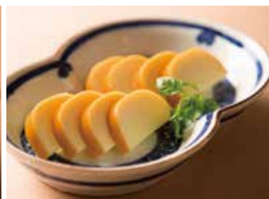
スモークチーズ Smoked Cheese 540