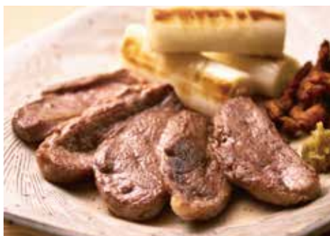
鴨ねぎ焼き Grilled Duck & Leek