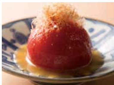
まるごと冷やしトマト Whole Chilled Tomato 690