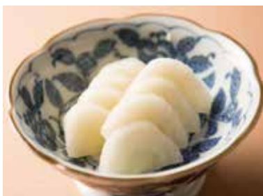
べったら漬 Pickled Radish in Salted Rice Malt 490