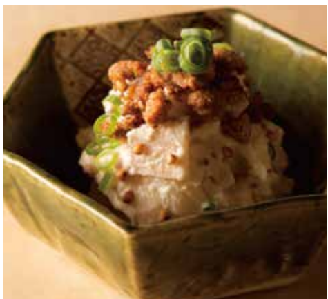
そば屋のポテトサラダ Potato Salad 590