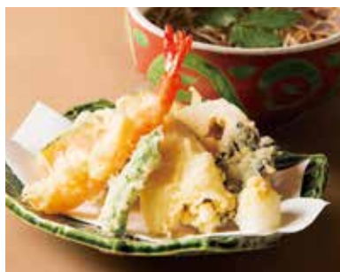
天ぷら盛り合わせとそば