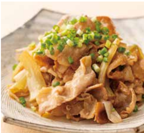
豚肉と葱のかえし焼き