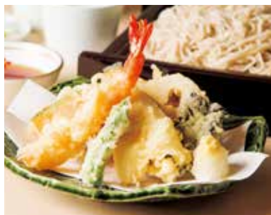
天ぷら盛り合わせとせいろ

7種(海老・きす・野菜4種・のり) Assorted Tempura & Cold Soba