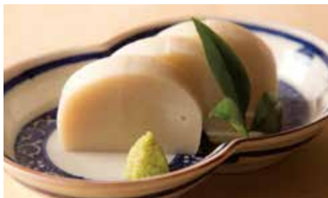
小田原鈴廣 板わさ