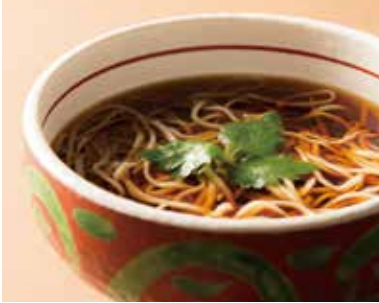
かけそば Soba 940