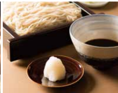
おろしせいろ Cold Soba with Grated Radish 1,090