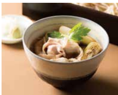
肉汁せいろ Cold Soba with Simmered Pork Sauce 1,340