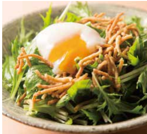
水菜のサラダ Potherb Mustard Salad 590