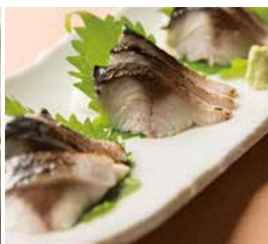
炙りしめ鯖 Seared Vinegared Mackerel 690