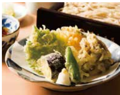
野菜天せいろ Cold Soba with Vegetable Tempura 1,190