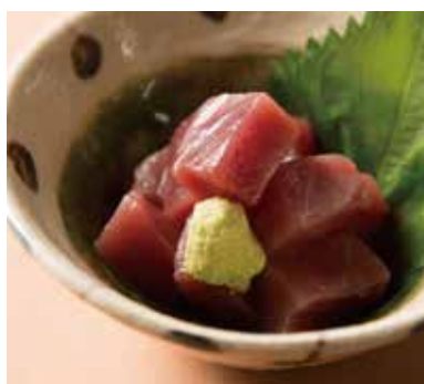
まぐろぶつ Tuna 890