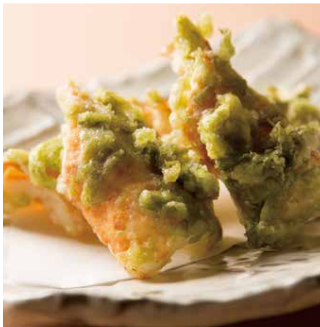
鯛ちくわの磯辺揚げ

Tube-shaped Fish Paste Cake Tempura with Seaweed