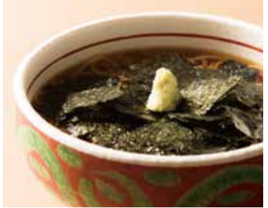
花巻そば Soba with Seaweed 1,190