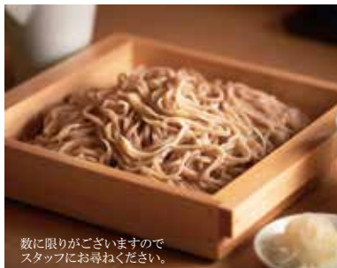
玄そば 数量限定 GEN Soba [Limited Offer] 890