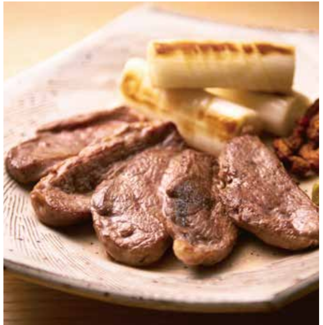
鴨ねぎ焼き Grilled Duck & Leek 1,490