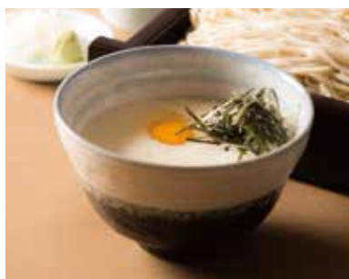
とろろせいろ Cold Soba with Grated Yam 1,240