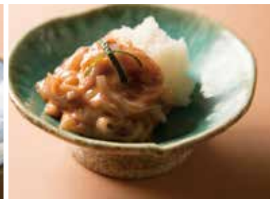
塩辛 Salted Squid Guts 340