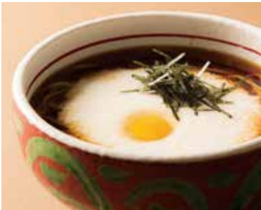
山かけそば Soba with Grated Yam 1,240