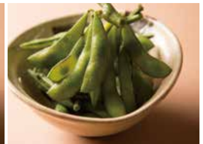
枝豆 Edamame 340