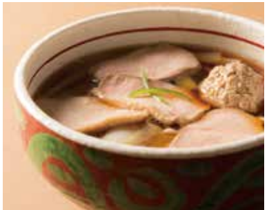
鴨南蛮そば Soba with Simmered Duck 1,640