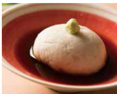
そばがき Soba Dumpling 490