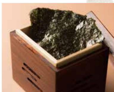
焼きのり Dried Seaweed 340