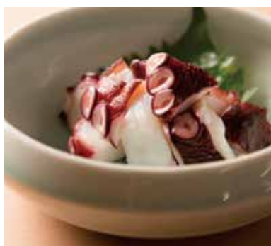
たこぶつ Cut Boiled Octopus 790