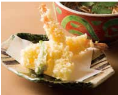
海老天そば Soba with Prawn Tempura 1,590