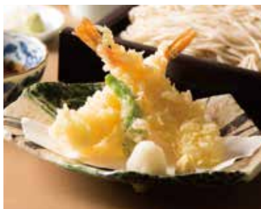
海老天せいろ Cold Soba with Prawn Tempura 1,590