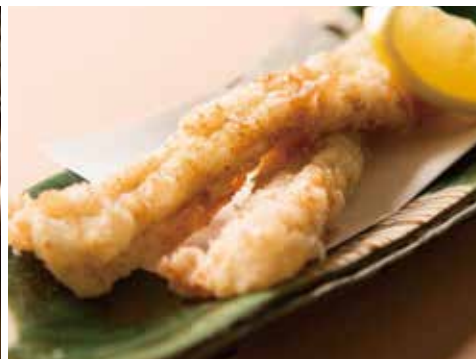
穴子の唐揚げ Deep-fried Conger Eel 1,190