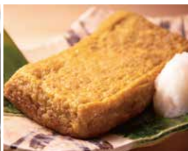
だし巻き玉子 Japanese Egg Omelet 640