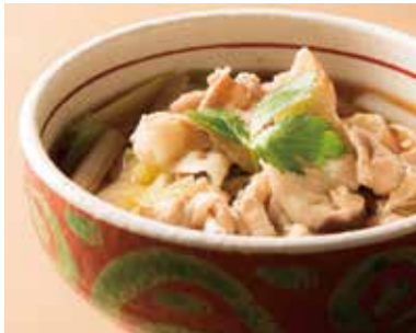
肉そば Soba with Simmered Pork 1,340