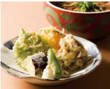
野菜天そば Soba with Vegetable Tempura 1,190