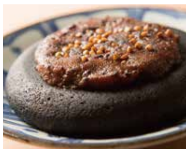
石焼きそば味噌 Soba Miso-Miso, Buckwheat & Leek are Mixed & Baked 390