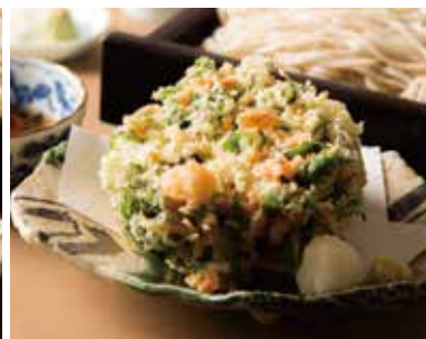
桜海老と小柱のかき揚げせいろ Cold Soba with Mixed Tempura with Sakura Shrimp & Small Scallop 1,940

数量限定玄そばへの変更も承ります。そばの大盛り プラス 330円 Soba can change to GEN soba. Large size of soba +incl.tax 330yen.