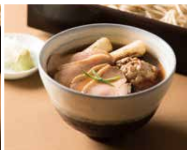
鴨汁せいろ Cold Soba with Duck & Duck Ball Sauce 1,640