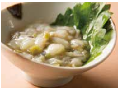
たこわさび Marinated Octopus with Wasabi Sauce 440