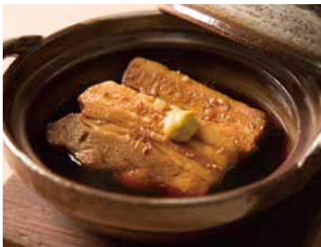
豚の角煮 Simmered Pork 990