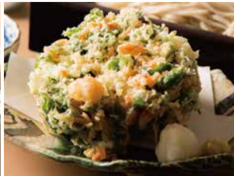
桜海老と小柱のかき揚げ Mixed Tempura with Sakura Shrimp & Small Scallop 990