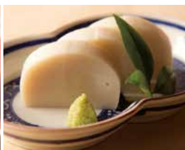
小田原鈴廣 板わさ Steamed Minced Fish 790