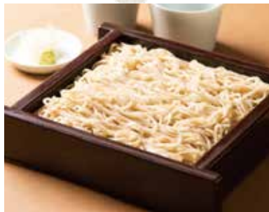
石臼挽きせいろ ISHIUSUBIKI Soba 890