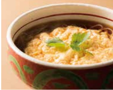
玉子とじそば Soba with Egg 1,090