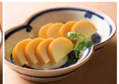
スモークチーズ Smoked Cheese 490