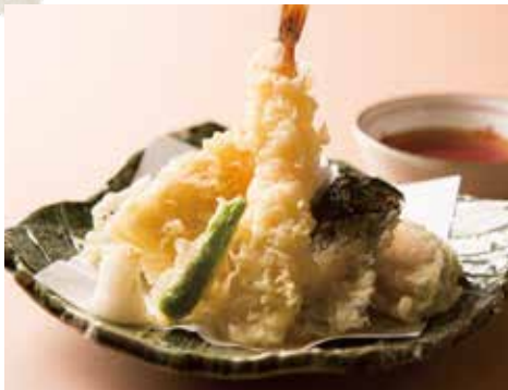
天ぷら盛り合わせ Assorted Tempura 790