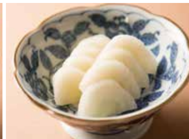
べったら漬 Pickled Radish in Salted Rice Malt 440