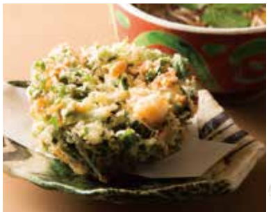
桜海老と小柱のかき揚げそば Soba with Mixed Tempura with Sakura Shrimp & Small Scallop 1,940

数量限定玄そばへの変更も承ります。そばの大盛り プラス 330円 Soba can change to GEN soba. Large size of soba +incl.tax 330yen.