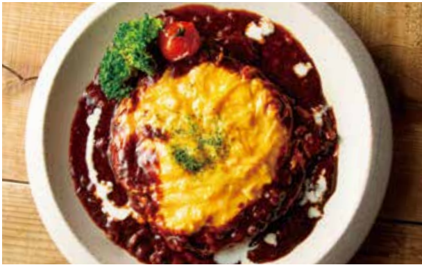
デミグラスソースのオムライス 1,100 Omelet Rice with Demi-glace Sauce