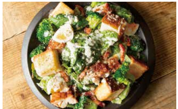
シーザーサラダ 1,250 Caesar Salad