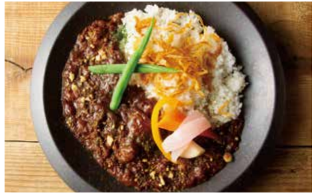
牛すじカレー 1,100 Beef Tendon Curry