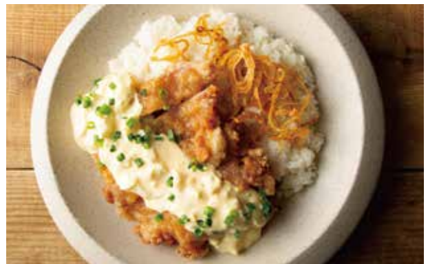
チキン南蛮プレート 1,200 Marinated Fried Chicken with Tartar Sauce & Rice Plate