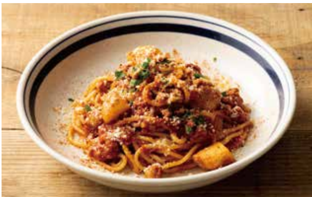
ケイジャンミートパスタ 1,200 Spicy Cajun Meat Pasta