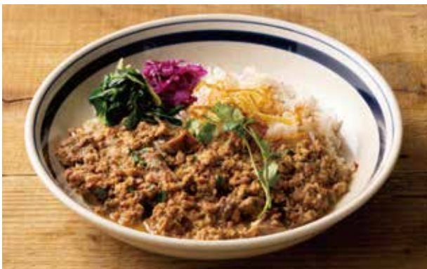
ダーティーチキンライス(アメリカ南部のソウルフード) 1,250 Dirty Chicken Rice