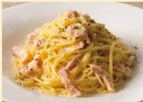
黒豚パンチェッタのカルボナーラ Carbonara Spaghetti with Pancetta