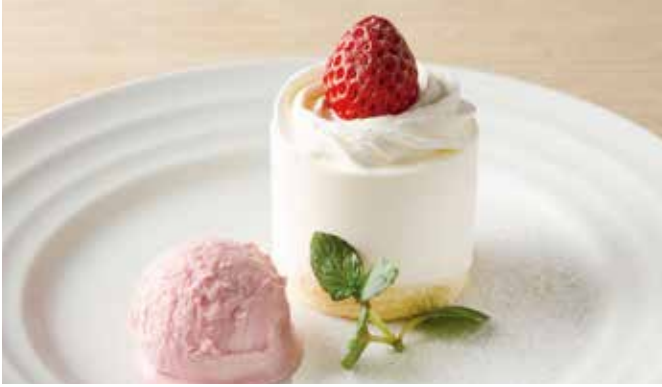
ガトーフーズ ストロベリーアイス添え 590(税込649) Gâteau Fraise with Strawberry Ice Cream