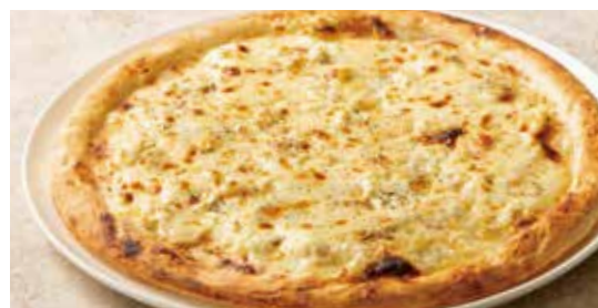
クワトロフォルマッジョ 4種のチーズ (モッツアレラ・ゴルゴンゾーラ・パルミジャーノ・ゴダ) Quattro Formaggio (Mozzarella, Gorgonzola, Parmigiano & Gouda)