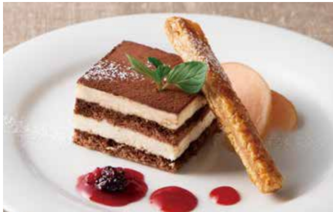
ティラミス 590(税込649) Tiramisu