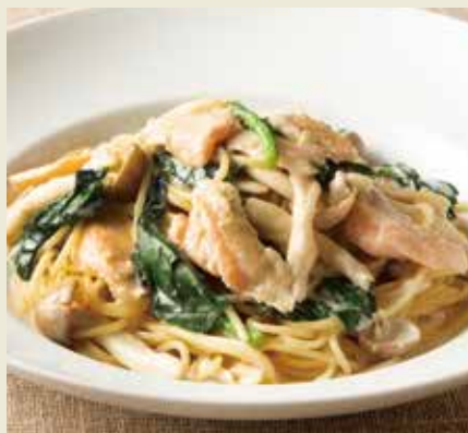
サーモンハラスとほうれん草の 味噌クリームソース ~生姜仕立て~ Miso & Ginger Cream Sauce Spaghetti with Salmon & Spinach 1,490(税込1,639)