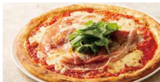
プロシュート・エ・ルッコラ (トマトソース・生ハム・ルッコラ・モッツアレラチーズ) Prosciutto e Rucola (Tomato Sauce, Dry-cured Ham, Rocket & Mozzarella)