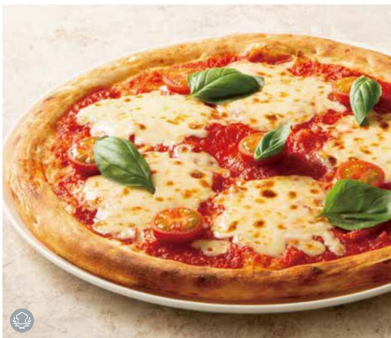
マルゲリータ (トマトソース・フレッシュトマト・モッツアレラチーズ・バジル) Margherita (Tomato Sauce, Fresh Tomato, Mozzarella & Basil)