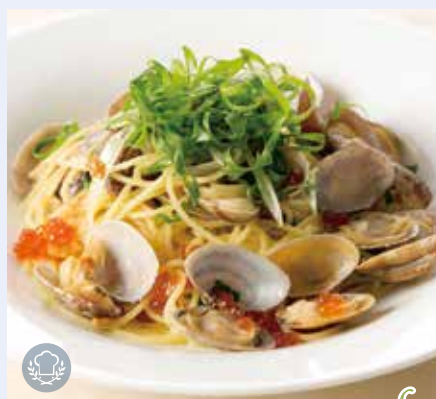
浅利・九条ネギ・イクラの ボンゴレビアンコ Vongole Bianco Spaghetti with White Clam, Kujo Green Onion & Salmon Roe 1,490(税込1,639)