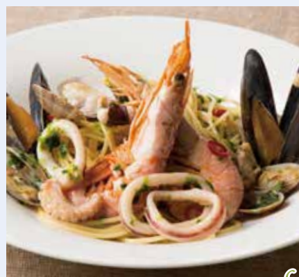
海の幸のペペロンチーノ 青海苔仕立て Seafood Peperoncino Spaghetti with Seaweed 1,590(税込1,749)