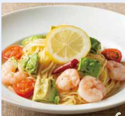
海老とアボカドの塩レモン Salted Lemon Spaghetti with Shrimps & Avocado 1,490(税込1,639)