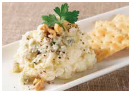
ゴルゴンゾーラのポテトサラダ Gorgonzola Potato Salad