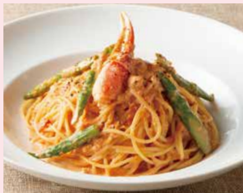
ずわい蟹とグリーンアスパラガスの トマトクリームソース Tomato Cream Sauce Spaghetti with Snow Crab & Green Asparagus 1,590(税込1,749)