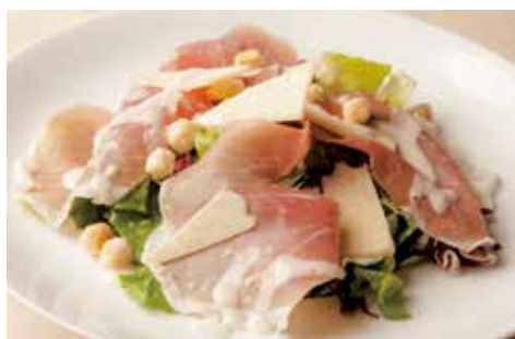
生ハムとロメインレタスの シーザーサラダ

Dry-cured Ham & Romaine Lettuce Caesar Salad