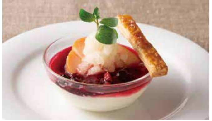
パナコッタ ベリーソースと季節のソルベ 590(税込649) Panna Cotta with Berry Sauce & Seasonal Sorbet