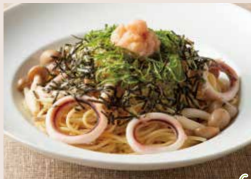
明太子とするめいかの和風 Japanese Spaghetti with Cod Roe & Squid 1,490(税込1,639)