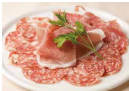
生ハムとサラミの盛り合わせ Dry-cured Ham & Salami Platter