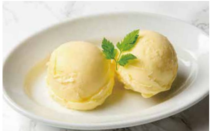
バニラアイスクリーム 390(税込429) Vanilla Ice Cream

デザート盛り合わせ ~ティラミスと本日のデザートにバニラアイス添えて~ 980(税込1,078) Assorted Dessert ~Tiramisu & Today's Dessert with Vanilla Ice Cream~