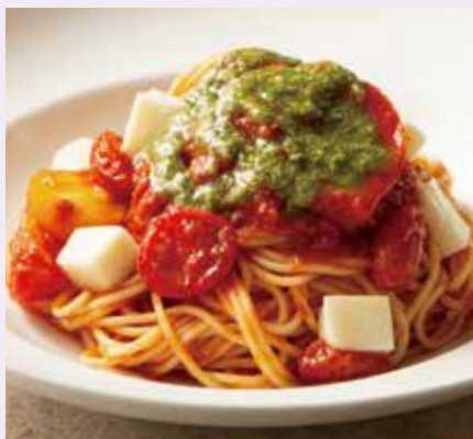
モッツアレラチーズと4種トマトのポモドーロ Pomodoro Spaghetti with 4 kinds of Tomatoes & Mozzarella Cheese 1,390(税込1,529)