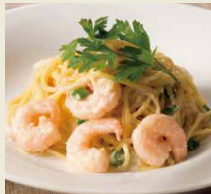
海老とたらこのクリームソース Cream Sauce Spaghetti with Shrimps & Cod Roe 1,490(税込1,639)