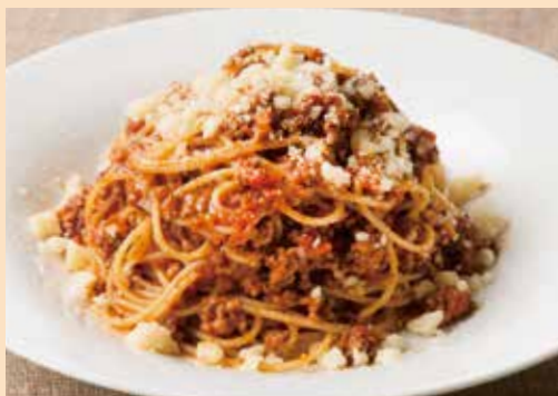
イベリコ豚のボロネーゼ Bolognese Spaghetti