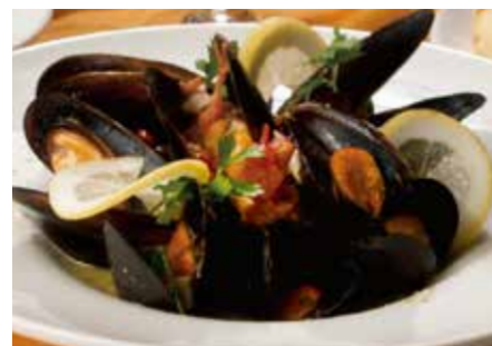
ムール貝の白ワイン蒸し バジリコバター Steamed Mussel with White Wine & Basil Butter