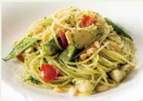
帆立とオクラのジェノベーゼ Genovese Sauce Spaghetti with Scallop & Okura 1,390(税込1,529)