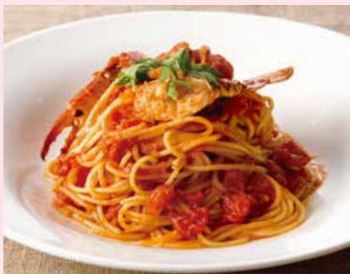
渡り蟹の濃厚トマトクリームソース Tomato Cream Sauce Spaghetti with Blue Crab 1,390(税込1,529)