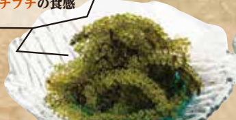
沖縄生海ぶどう 799(税込878)