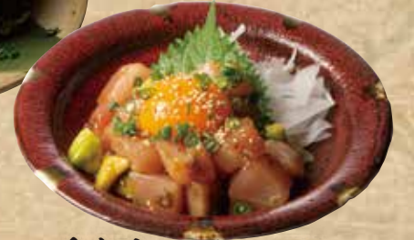
まぐろユッケ 699(税込768)