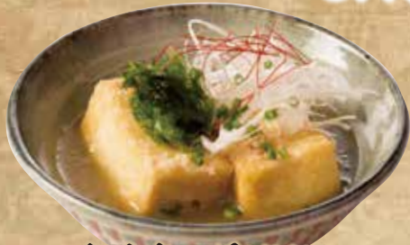
島豆腐の揚げだし 499(税込548)