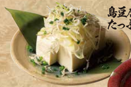
島豆腐と たっぷりじゃこ葱冷奴 599(税込658)