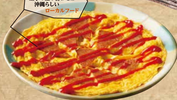
海人酒房のポーク玉子 699(税込768)