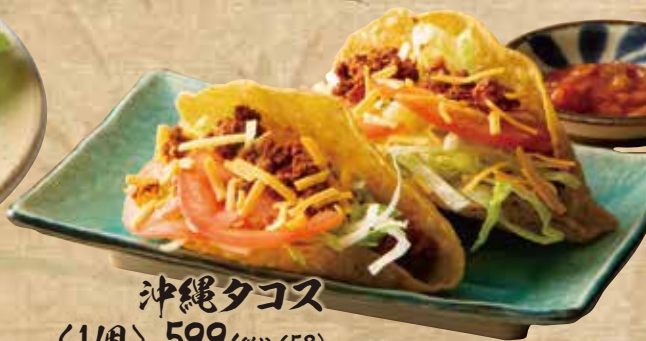
沖縄タコス <1個> 599(税込658)