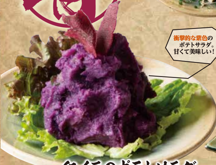
紅イモのポテトサラダ 599(税込658)