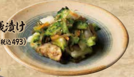
ゴーヤと野菜の浅漬け 449(税込493)