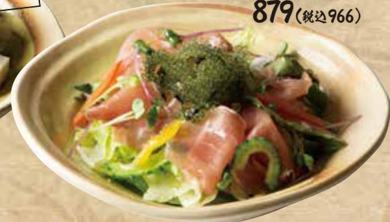
あぐー豚の生ハムサラダ 879(税込966)