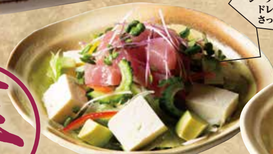
まぐろサラダ 779(税込856)