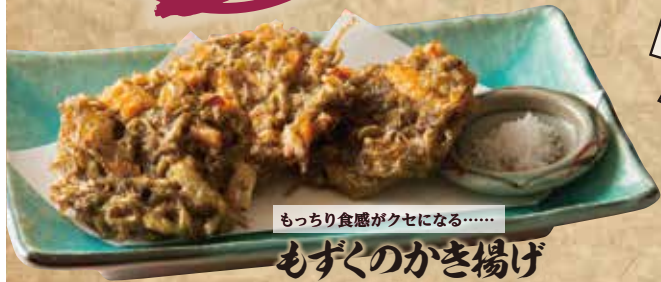
もちり食感がクセになる…… もずくのかき揚げ 599(税込658)