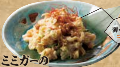
ミミガーの ピーナッツ和え 699(税込768)