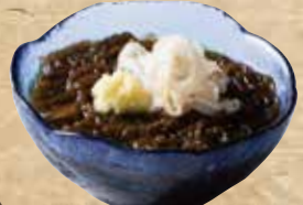
沖縄生もずく酢 679(税込746)