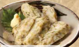
あおさのり(アーサー)がたっぷり アーサーかまぼこ 599(税込658)