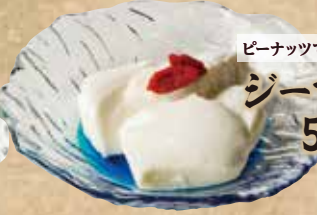
ジーマミ豆腐 599(税込658)